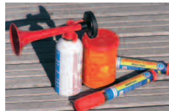
Fig.6 - Dotazioni di emergenza

Se ci si allontana dalla costa oltre un miglio, e non oltre le tre miglia, saranno necessari a bordo anche una boetta fumogena (Fig.6), due fuochi a mano a luce rossa (razzi di segnalazione), un apparecchio