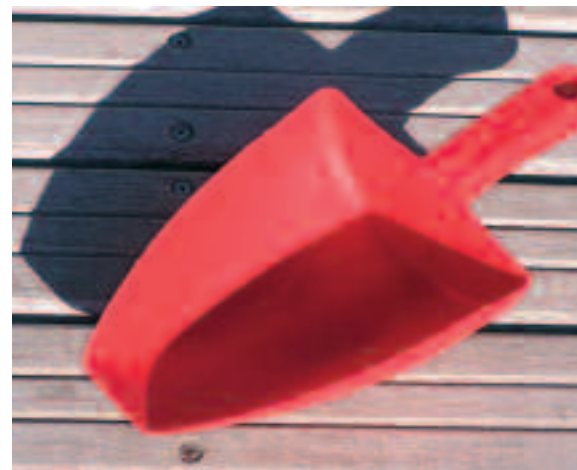
Fig.5 - La sassola

che, porta in cima proprio un mezzo marinaio.