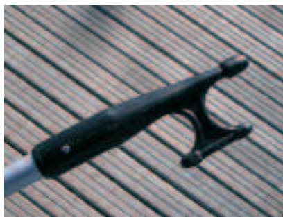
Fig.4 - L'estremità del mezzo marinaio

sono i nodi. Quelli esistenti sono più di un centinaio, ma quelli necessari a bordo non superano la quindicina: ma questi bisogna saperli fare perfettamente ed in qualsiasi condizione, anche al buio!