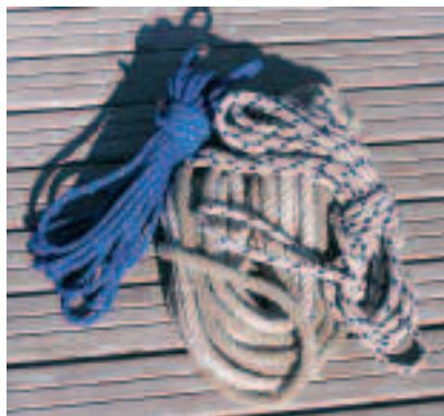
Fig.3 - Varie cime

(Fig.3) - A bordo esistono metri e metri di cordami, ma