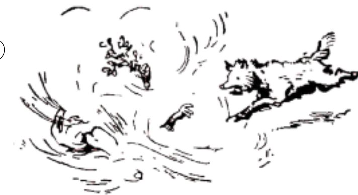
... poi si gettava al suolo, sollevando una nuvola di polvere: lo sciacallo ci si lanciava dentro per unirsi al combattimento e veniva catturato.

Il resto di questa chiacchierata sapete dove trovarlo: parchi, riserve, oasi protette vi aspettano!