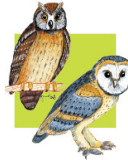
2. l'assiolo (a sinistra), 3. I barbagianni (a destra)

pi, il gheppio non ha alcun problema di carattere alimentare, anzi il cibo gli avanza! In suo aiuto arrivano rapaci notturni quali l' assiolo (2.) ed il barbagianni (3.) : specialisti nella caccia notturna. Questi nidificano in campanili o torri.