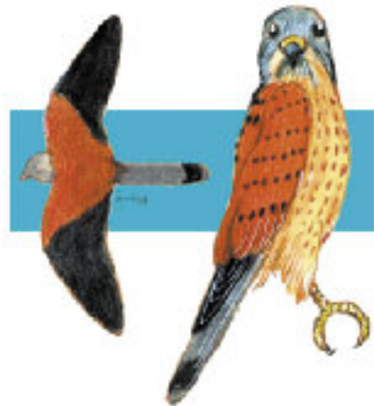
1. Il gheppio

La presenza massiccia di colombi ha attirato dei predatori naturali, quali il gheppio (1.) . Piccolo falco che nidifica anche sui cornicioni delle case, e caccia con facilità colombi ed altri uccelli di piccola taglia. Poiché, tra i rifiuti cittadini, proliferano anche i to-