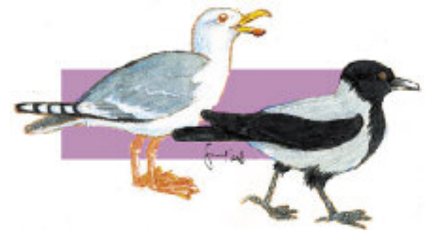
4. La cornacchia (a destra), 5. il gabbiano (a sinistra)

Ma nemmeno questi tre personaggi sono stati in grado di porre un freno alla prolificità dei colombi, per cui ci si mette anche l'uomo. Come? Importando le cornacchie grigie (4.) , che come tutti i loro cugini corvidi, hanno la cattiva abitudine di razzare i nidi