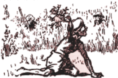
In India, si cacciava lo sciacallo in un modo speciale. Un uomo imitava i richiami di un intero branco di sciacalli scuotendo delle foglie secche...