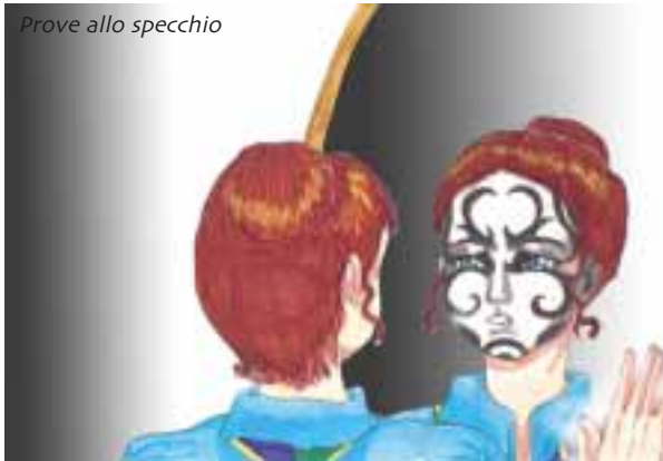
Prove allo specchio

Al contrario invece, prima di un grande evento, magari della realizzazione della fase finale di un'impresa di Squadriglia o di Reparto, oppure prima dell'entrata in scena per lo spettacolo che avete preparato per tutto il quartiere, è necessario caricarsi: bisogna fare in modo che lo spirito di gruppo entri in gioco per