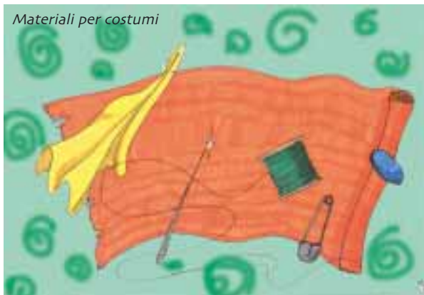
Materiali per costumi

Quando invece la vostra animazione dovrà puntare a sviluppare la fantasia dei vostri uditori, allora cominciate a raccontare , magari storie di mistero che lasciano qualcosa in